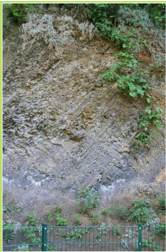
Abb. 5: Ton- und Schluffsteine im Hangenden von Flöz Dünnebank

Im Hangenden von Flöz Dünnebank stehen Ton- und Schluffsteine an, die entlang der nördlichen Aufschlusswand des Geologischen Gartens zu sehen sind (Abb. 5 und Standort 3 in Abb. 1), dann folgt ein sandiger Schluffstein und schließlich, unmittelbar unterhalb von Flöz Dickebank, erneut ein Wurzelboden.