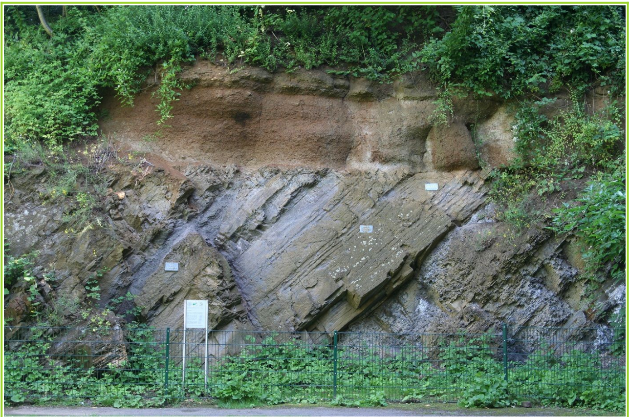
Abb. 7: Diskordanz Karbon-Kreide

Im Geologischen Garten in Bochum-Wiemelhausen lässt sich die Diskordanz, also der scharfe Knick zwischen den aufgerichteten und abgetragenen Karbonschichten und den darüber horizontal liegenden Kreideschichten, sehr gut betrachten (Abb. 7, Standort 5 in Abb. 1).