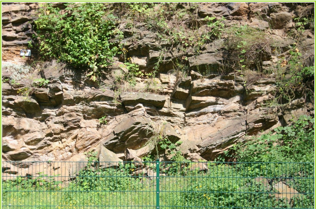
Abb. 6: Dickebank-Sandstein

Der Dickebank-Sandstein entstand in einer Flussmündung oder im küstennahen Meeresbereich. Dieser harte und daher verwitterungsresistente Sandstein bildete während der Kreidezeit, als das Meer bis an den Südrand des Ruhrgebietes vordrang, eine Klippe, die aus dem Wasser herausragte. Daher wird der Dickebank-Sandstein im Geologischen Garten auch nicht von Sedimente der Kreidezeit bedeckt. Solche Auftragungen, die der Überflutung durch das vorrückende Kreidemeer standhielten, sind auch von anderen Stellen am Südrand des Ruhrgebietes bekannt. Der Dickebank-Sandstein wurde früher gerne als Baumaterial verwendet und an manchem historischen Gebäude in Bochum lässt sich dieser schrägschichtete Sandstein nachweisen.