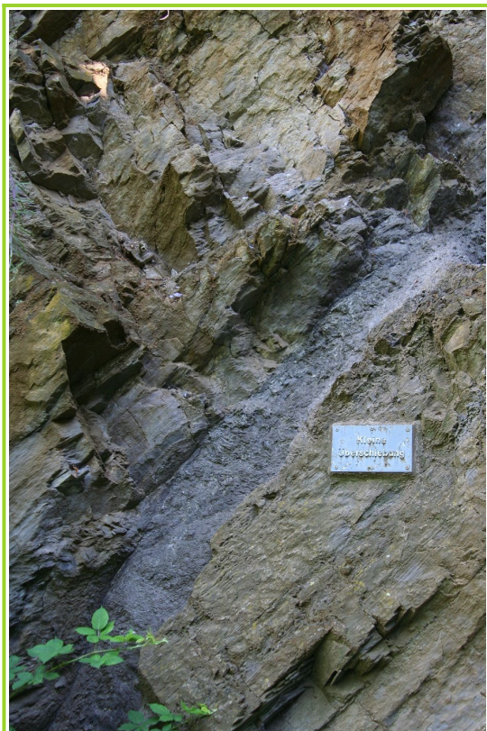
Abb. 4: Überschiebung mit Ruschelzone

nische Einengung wurden die Gesteinspartien im linken Bereich der Aufschlusswand über die Gesteine auf der rechten Seite geschoben. Dabei hat sich entlang der Gleitbahn eine Zerrüttungszone (Ruschelzone) gebildet, in der das Gestein durch die starke tektonische Beanspruchung feinkörnig zermahlen wurde. Ausgebildet hat sich diese Überschiebungsbahn in einer weniger harten Schluffschiebt. Erkennbar sind im Gesteinsblock auf der linken Seite Verschleppungen an der Kontaktfläche zu der Überschiebung.