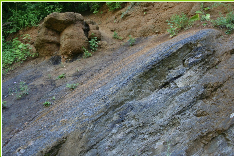
Abb. 3: Flöz Wasserfall